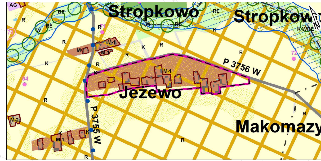
Wyrys z obowiązującego Studium uwarunkowań i kierunków zagospodarowania przestrzennego gminy Zawidz przyjętego uchwałą nr 175/XXXIV/2014 Rady Gminy Zawidz z dnia 18 września 2014 r.