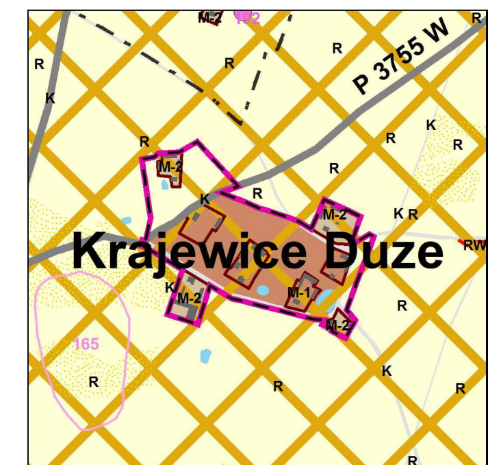
wyrys z obowiązującego Studium uwarunkowań i kierunków zagospodarowania przestrzennego gminy Zawidz przyjętego uchwałą nr 175/XXIV/2014 Rady Gminy Zawidz z dnia 18 września 2014 r.