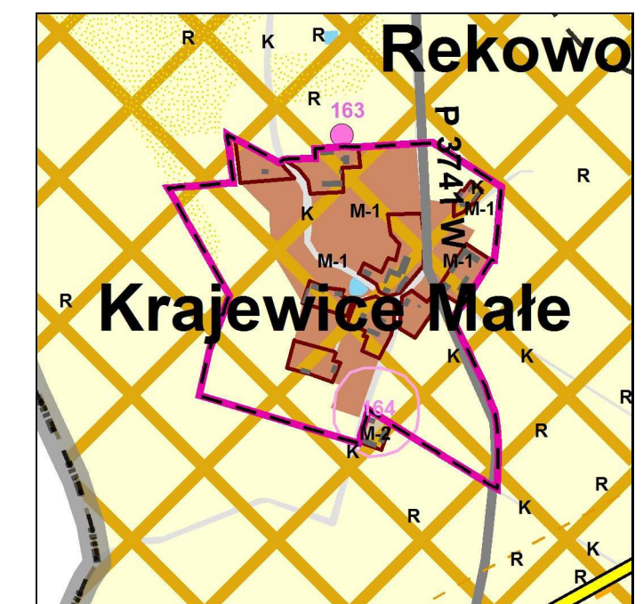
wyrys z obowiązującego Studium uwarunkowań i kierunków zagospodarowania przestrzennego gminy Zawidz przyjętego uchwałą nr 175/XXXIV/2014 Rady Gminy Zawidz z dnia 18 września 2014 r.