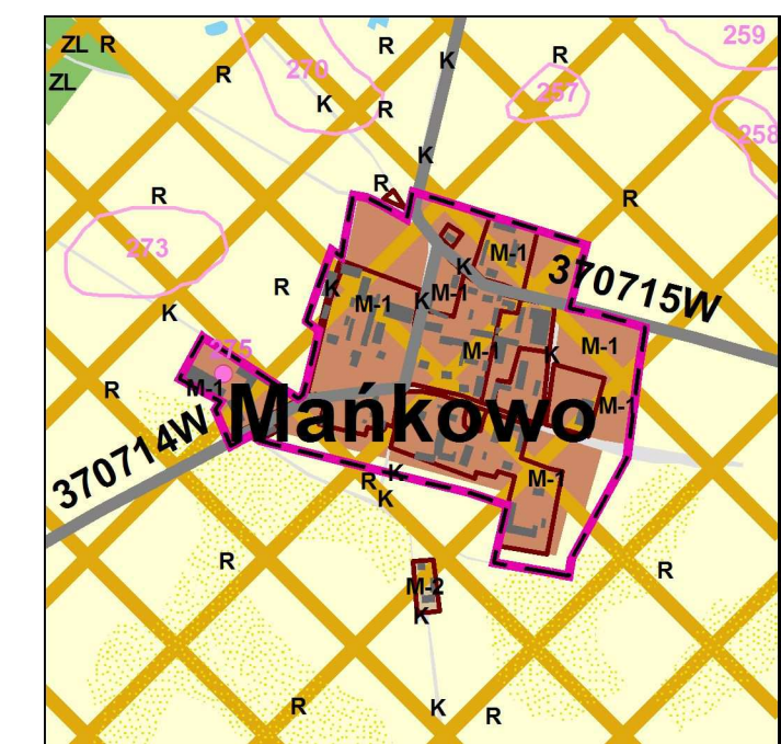
wyrys z obowiązującego Studium uwarunkowań i kierunków zagospodarowania przestrzennego gminy Zawidz przyjętego uchwałą nr 175/XXXIV/2014 Rady Gminy Zawidz z dnia 18 września 2014 r.