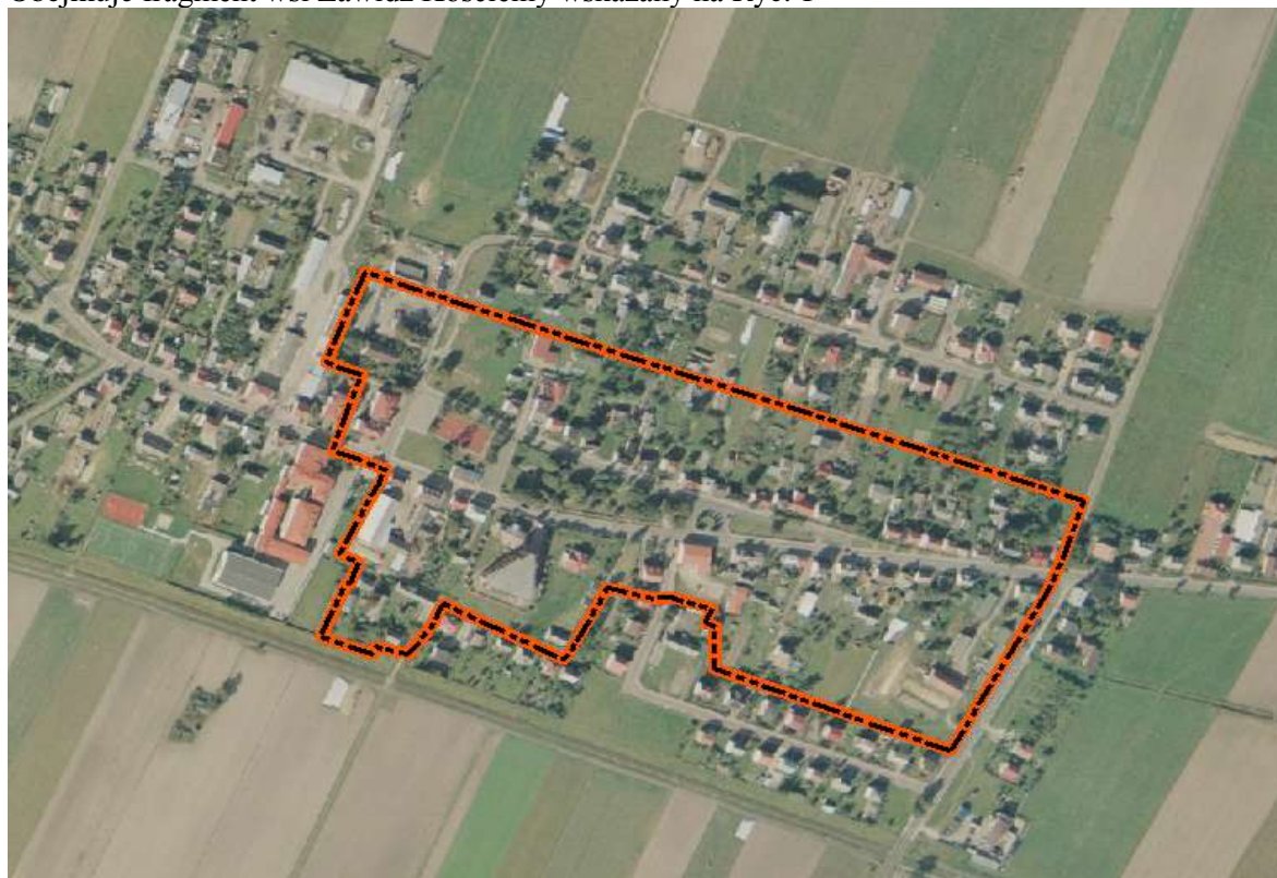
Ryc. 1 Zasięg układu ruralistycznego wsi Zawidz Kościelny

Obejmuje fragment wsi Zawidz Kościelny wskazany na Ryc. 1