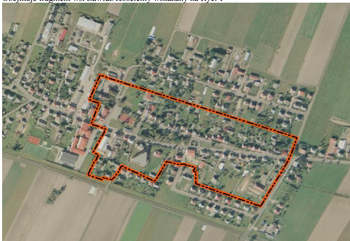
Ryc. 1 Zasięg układu ruralistycznego wsi Zawidz Kościelny

Obejmuje fragment wsi Zawidz Kościelny wskazany na Ryc. 1